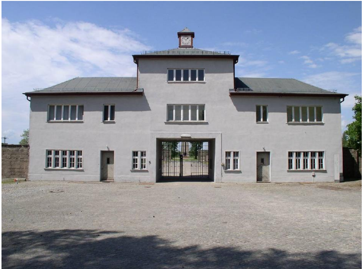
Torgebäude von Sachsenhausen