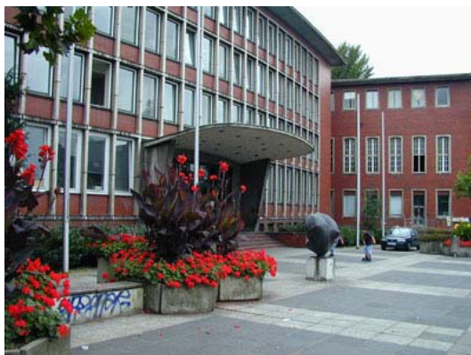
Neues Rathaus Wattenscheid Eingang

Zum alten Gebäudeteil kam 1957 ein Trakt mit moderner Fassade hinzu. Fertig war der neue Teil nach rund zweijähriger Bauzeit, eingeweiht am 21. November 1957. Zwar wurde der neue Teil als Anbau bezeichnet, doch gibt es keinen Zweifel darüber, dass er das neue Rathaus sein sollte. Bestätigung dafür war, dass die Amtszimmer des Oberbürgermeisters und des Oberstadtdirektors in dem neuen Flügel eingerichtet wurden. Nach dieser Erweiterung standen 150 Räume zur Verfügung.