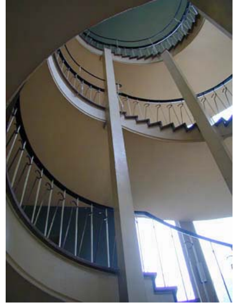
Neues Rathaus Wattenscheid Treppenhaus