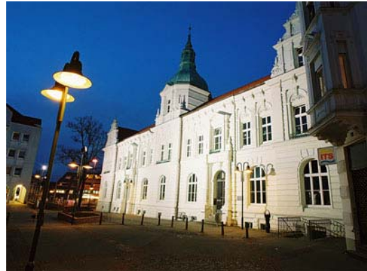
Altes Rathaus Wattenscheid Nachtaufnahme