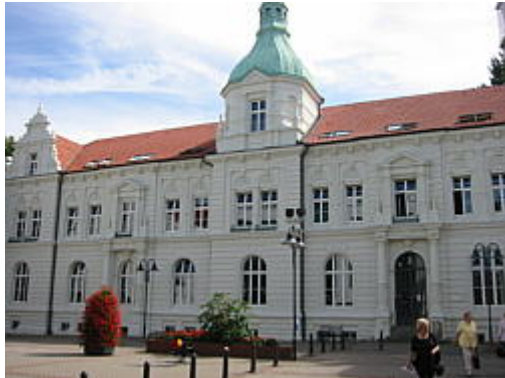
Altes Rathaus Wattenscheid

Das Rathaus wurde im Stil der Spät-Renaissance erbaut. Wegen Platzmangel wurde der Rathausaltbau in den folgenden Jahrzehnten erweitert.