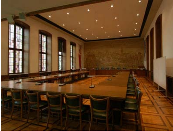
Neues Rathaus Wattenscheid Ratssaal